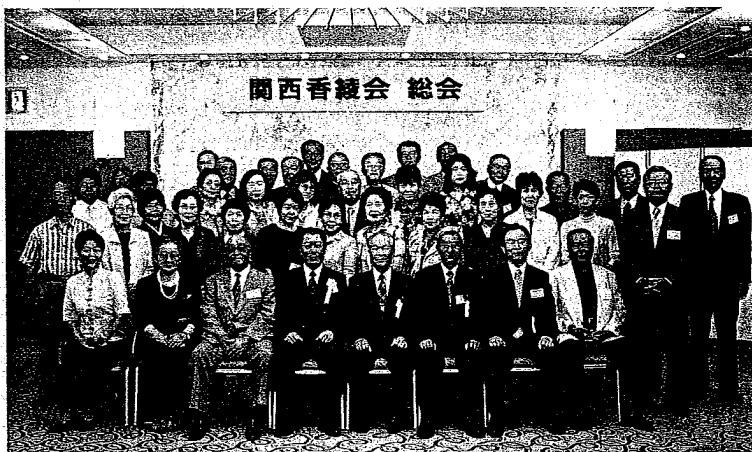
(平成14年度、関西支部総会ご出席者の皆様)

香綾会本部総会のチケットは 関西支部事務局まで 日時：平成14年11月17日(日)13時 会場：グランドハイアット福岡 会費：6000円 (但し51〜54回生は3000円)