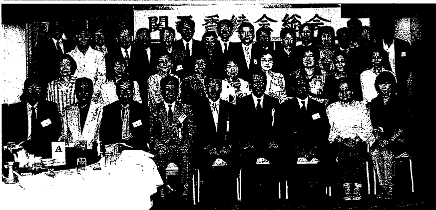
(平成13年度、関西支部総会ご出席者の皆様)

以上のように「楽しい総会」「読み易い会報」を目指して、皆様の「プラスワン」のご意見を取り入れながら、「拠り所」としての総会を願っています。