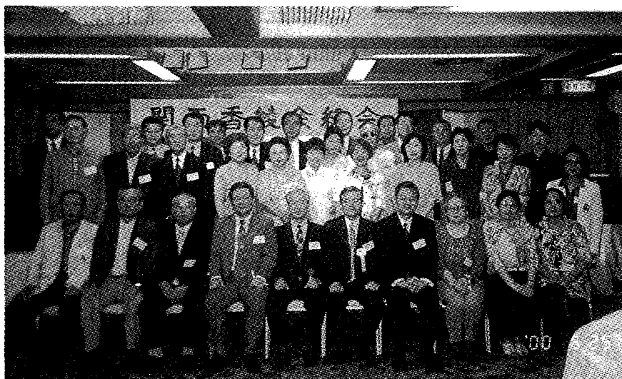
(平成12年度、関西支部総会でご出席者の皆様)