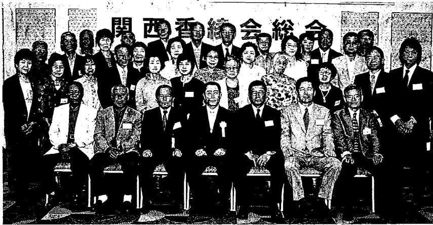
(平成17年度、関西支部総会ご出席者の皆様)

香綾会本部総会のチケットは 関西支部事務局まで 日時・平成17年10月30日(日)13時 会場・ホテル ニューオータニ博多 会費・6000円 (但し54〜57回生は3000円)