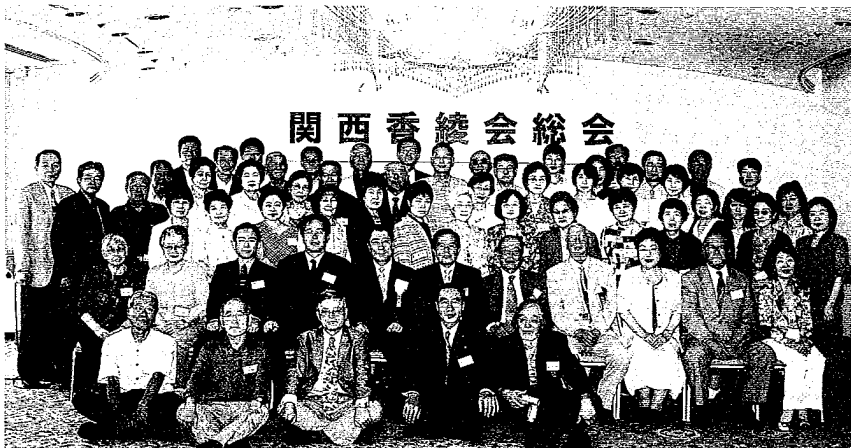
(平成16年度、関西支部総会ご出席者の皆様)